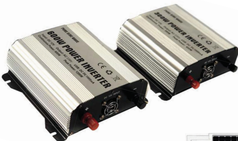
PSW12-300 et PSW12-600